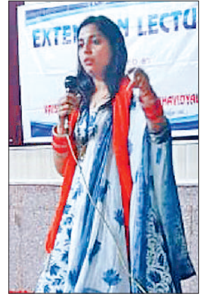
छात्राओं को संबोधित करती वक्ता।