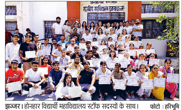
झज्जर। होनहार विद्यार्थी महाविद्यालय स्टाफ सदस्यों के साथ।