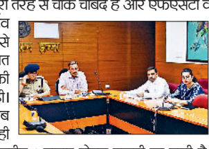
झज्जर। डीसी ने एफएसटी व एसएसटी टीमों को सतर्कता से कार्य करने के लिए निर्देश

झज्जर। जिले में कानून व्यवस्था पूरी तरह से चाक चौबंद है और एफएसटी व एसएसटी टीमों को सतर्कता से कार्य करने के लिए निर्देश