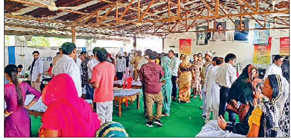
झज्जर। रक्तदान शिविर में उपस्थित रक्तदाताओं की भीड़।