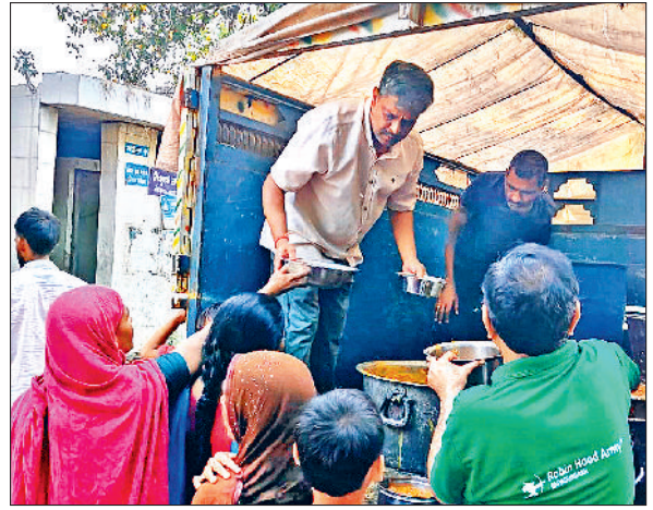
बहादुरगढ़। लोगों को प्रसाद बांटते आरएचए के सदस्य।