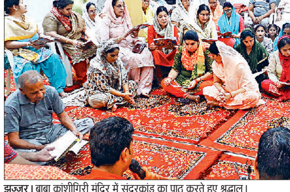
झज्जर। बाबा कांशीगिरी मंदिर में सुंदरकांड का पाठ करते हुए श्रद्धालु।