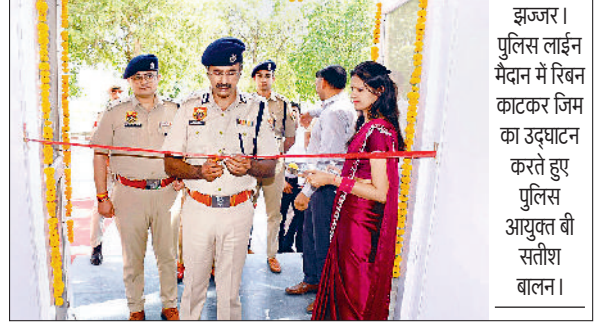
झज्जर। पुलिस लाइन मैदान में रिबन काटकर जिम का उद्घाटन करते हुए पुलिस आयुक्त वी सतीश बालन।

बुधवार को जिला पुलिस आयुक्त वी सतीश बालन ने पुलिस लाइन मैदान में आधुनिक जिम का उद्घाटन किया। उन्होंने कहा कि जिम बनाने का मुख्य उद्देश्य जवानों को फिट व तंदुरुस्त बनाए रखना है। उन्होंने पुलिस जवानों से कहा कि पुलिस लाइन में जिम का भरपूर लाभ उठाएं और मेहनत कर अपने को आप को फिट और स्वस्थ बनाए रखें। जिससे पुलिस कर्मी को परफॉर्मेंस में सुधार होगा। उन्होंने कहा कि पुलिस